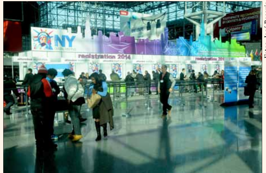
La zona de inscripción del Gran Congreso de Nueva York.