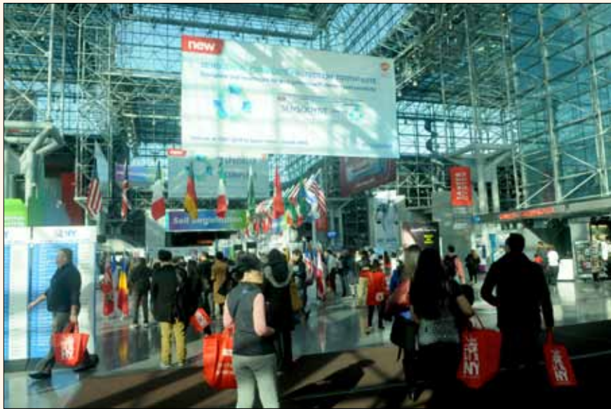
La entrada al Greater New York Dental Meeting, que en 2014 superó los 50.000 asistentes.