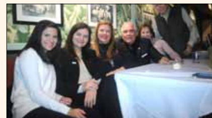
Un grupo de invitados.