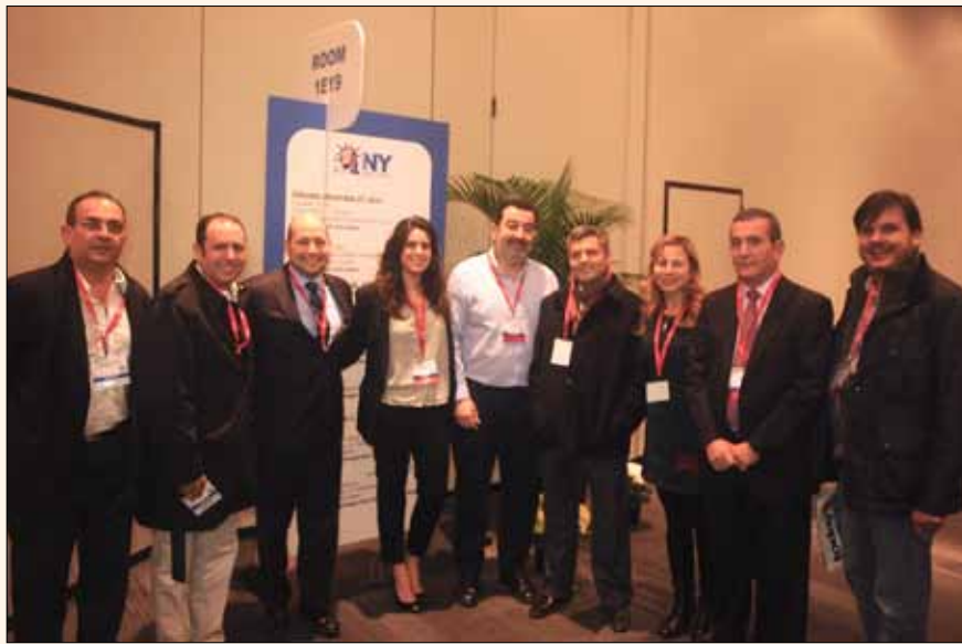
Los conferencistas del programa de SIOLA frente al salón de conferencias.