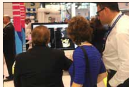
Un especialista explica el funcionamiento de un software digital de rayos x.