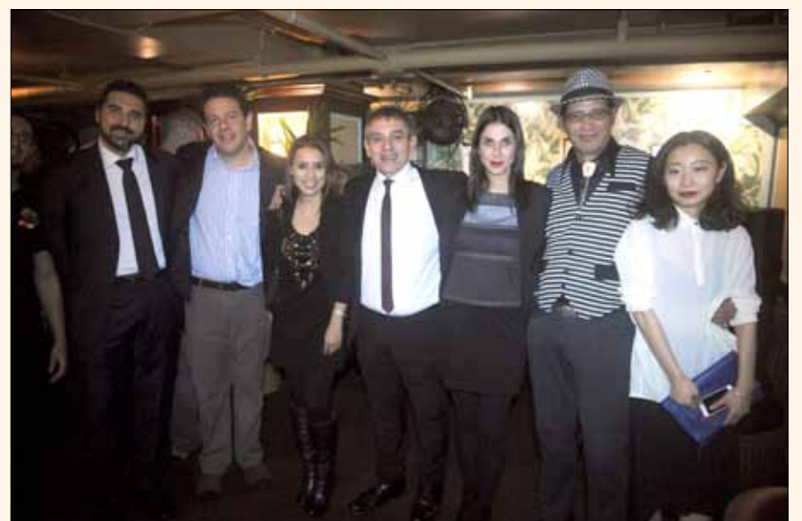
Un grupo de invitados al evento organizado por la Puerto Rican Dental Association, USA.