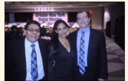
Representantes de la odontología mexicana en el almuerzo de gala del congreso.