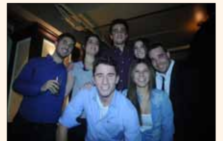
Un grupo de odontólogos puertorriqueños que ejercen en Nueva York.