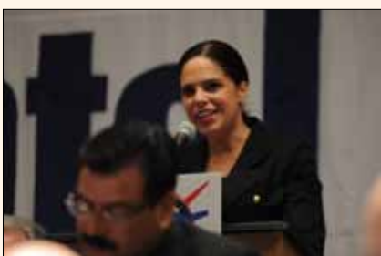
La periodista norteamericana Soledad O'Brien impartió el discurso que anualmente realiza un personaje famoso de EE UU durante el Almuerzo de Presidentes.