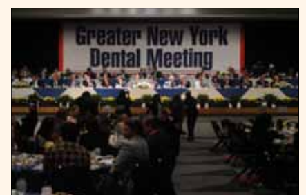
Panorámica del Almuerzo de Presidentes del Gran Congreso de Nueva York, uno de los actos protocolares que distinguen al GNYDM.