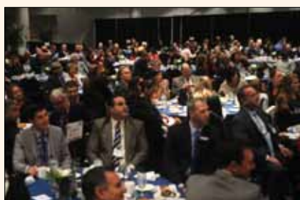
Vista de los asistentes al Almuerzo de Presidentes.