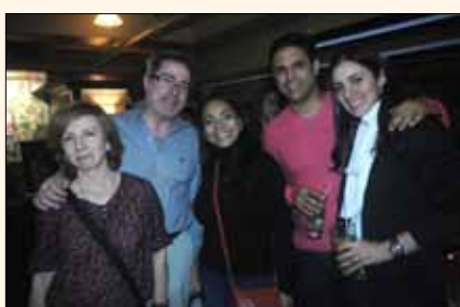
Jóvenes implantólogos posan para la cámara de José Antonio Rosario.