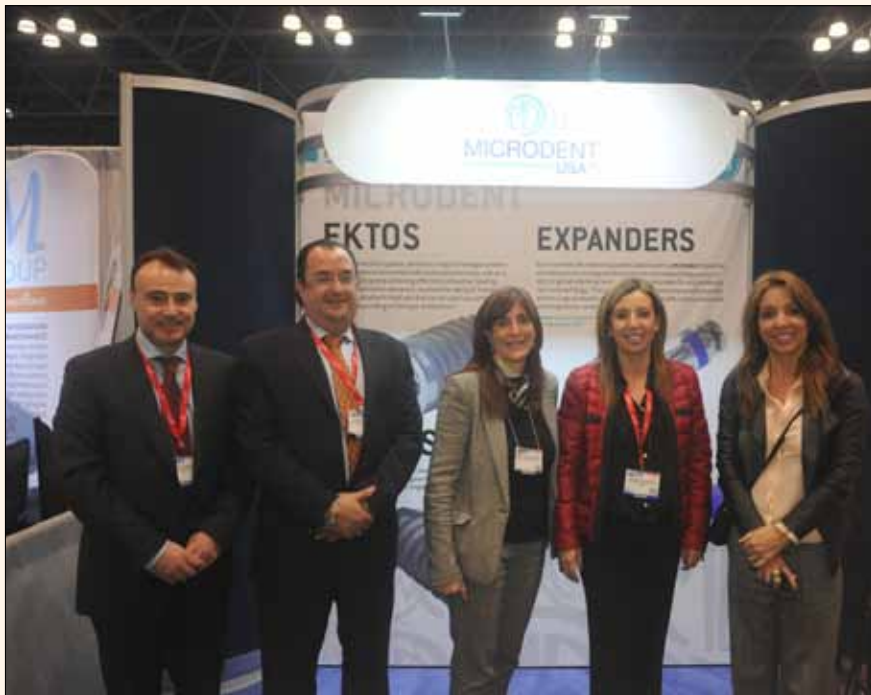
Las propietarias y directivos de Microdent en su stand en NY.

La presencia de la Federación Odontológica de Centroamérica y Panamá (FOCAP), la Federación Dental Ibero Latinoamericana (FDILA) o los Colegio de Cirujanos Dentistas de Puerto Rico y de São Paulo (Brasil), lo cuales organizan congresos en San José de Costa Rica y el mayor de Latinoamérica conocido como CIOSP. Además, estuvieron presentes en el GNYDM y organizaron charlas las asociaciones de odontólogos puertorriqueños y do-